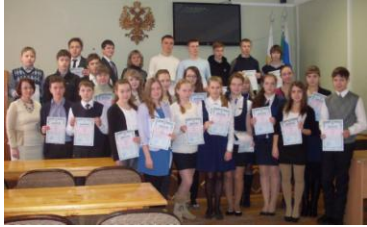
Стр.2 AFS лагерь